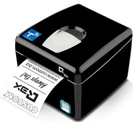
913FF030100733 Q3X-F RT ETH USB NERO TELEMATICA